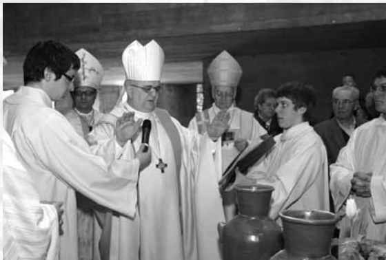
Bénédictio de l'huile des malades