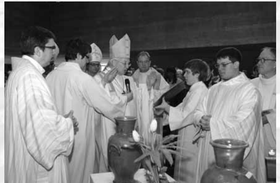
Bénédictio de l'huile des catéchumènes