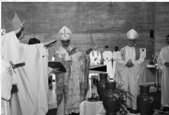
Bénédictio du saint chrême