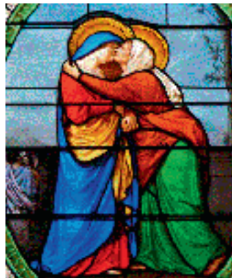
Visitation de Marie à sa cousine Elisabeth