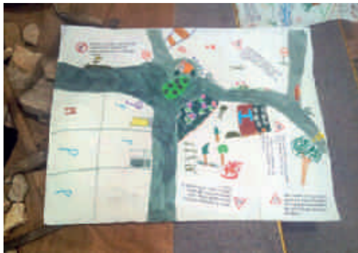
Fête du Pardon 2015; les signaux dans ma vie.

Le pape François, en déclarant une année sainte de la miséricorde, tient à inviter chacun à examiner ses choix et à prendre librement le chemin de la Vie, passant par celui du pardon de Dieu.