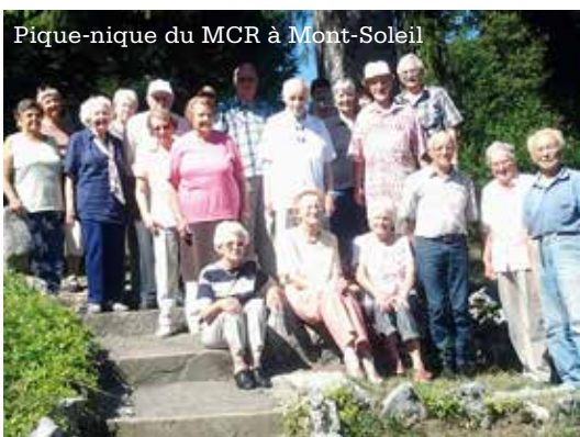
Pique-nique du MCR à Mont-Soleil