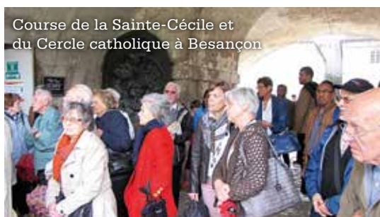
Course de la Sainte-Cécile et du Cercle catholique à Besançon