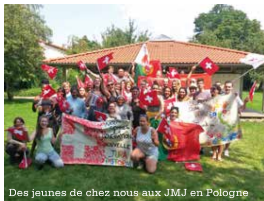
Des jeunes de chez nous aux JMJ en Pologne