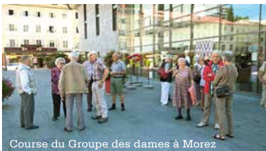
Course du Groupe des dames à Morez