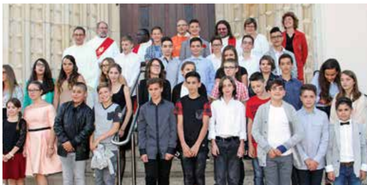
Les confirmés 2016