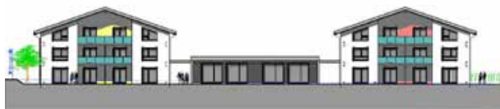
Le projet de création d'un bâtiment à vocation sociale et paroissiale (sur www.cathberne.ch/saintimier )

Des consultations préalables des fidèles, et surtout de paroissiens chevilles ouvrières de la construction de l'église, ont été dûment menées. Malgré les avis divergents, l'inopportunité de maintenir cet édifice est clairement ressortie. Les enjeux en lien avec le droit canonique et liturgique de l'Eglise catholique romaine en vue de la démolition d'une église et de la réaffectation ont aussi été évalués. Notons encore que des églises construites un peu partout en Suisse sur le même modèle ont déjà été démolies.