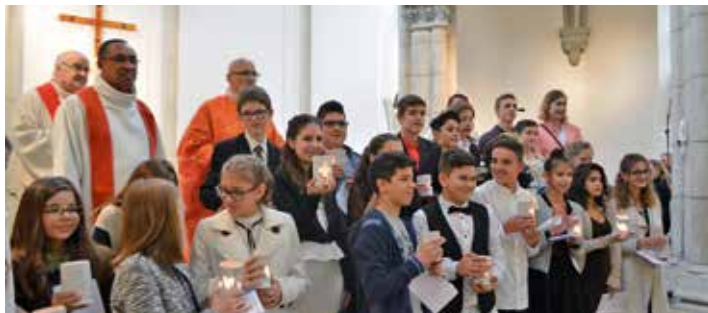
Les confirmés 2016

Tout au long du parcours de préparation, comme durant la célébration de la confirmation, les désormais confirmés se sont laissés atteindre par l'essence même de la vie résidant dans ce souffle originellement propulsé par le Christ ressuscité.