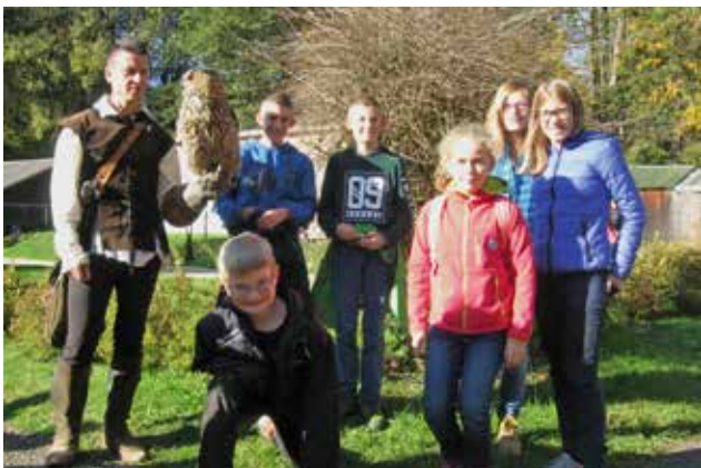
Sortie d'automne des plus jeunes servants de messe de St-Imier