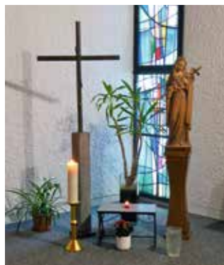
Consécration de sainte Thérèse