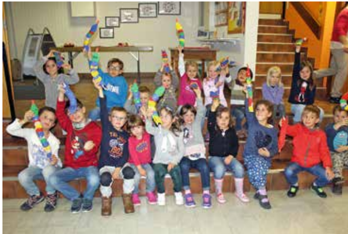
La joie fut bien au rendez-vous.

Entres autres animations, la Genèse leur a été racontée par une jolie animation. La journée s'est finie avec un bricolage ainsi qu'un goûter.