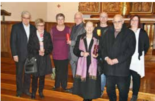
Fête de l'Amour