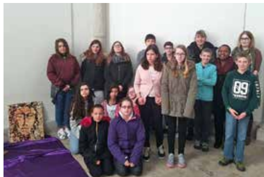
Les confirmands 2017