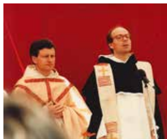
Première messe d'Edgar à La Neuveville, avec le dominicain Christoph von Schönborn, actuellement cardinal archevêque de Vienne, qui avait assumé la prédication de circonstance.

d'Edgar, à travers la communion des saints: la prière de la communauté chrétienne pour le salut des défunts, particulièrement durant l'Eucharistie, est très importante,