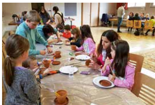
Les enfants de l'Eveil à la foi