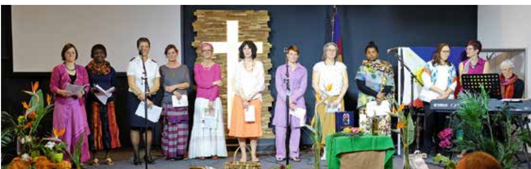
JMP à Tramelan