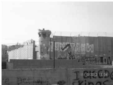
Mur de la honte