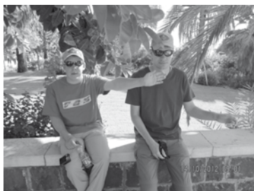
Les deux « benjamins » du groupe au Mont des Béatitudes