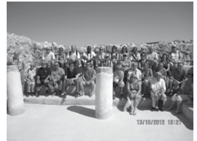
Visite de la forteresse hérodiennne de Massada