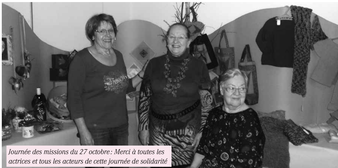
Journée des missions du 27 octobre: Merci à toutes les actrices et tous les acteurs de cette journée de solidarité