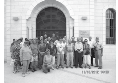
A Bethléem, dans la paroisse melkite ; devant la porte financée en partie par notre paroisse