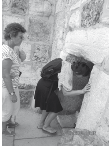
Basilique de la Nativité : il faut se faire tout petit pour se rendre au lieu de la naissance de l'Enfant-Dieu