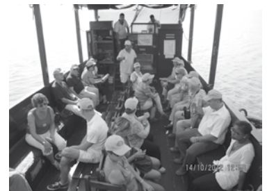
Déplacement sur la mer de Galilée... mais en bateau!