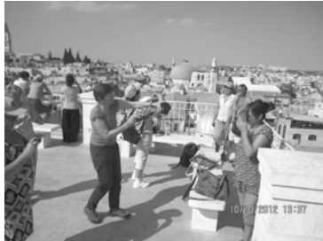
Vue sur Jérusalem : séance photo sur le toit des « maronites »