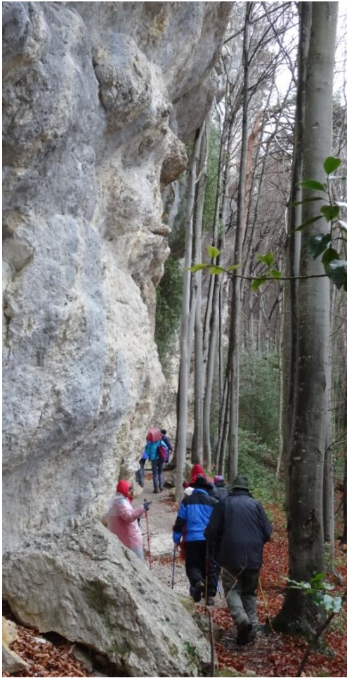
raser les murs des Rochers du Midi