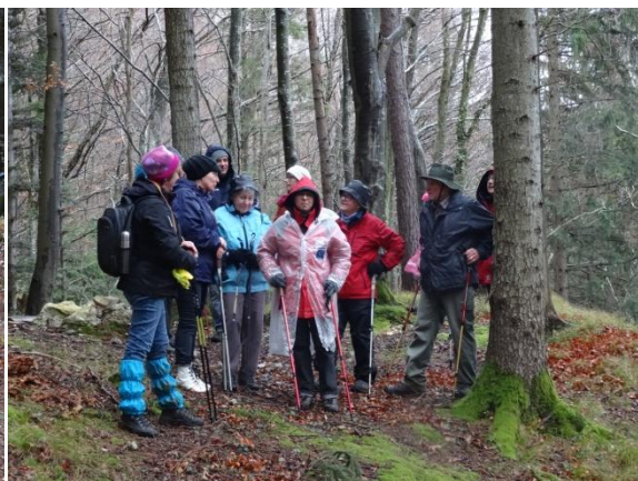
s'accorder une reprise de souffle