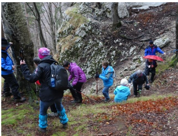
s'encorder pour ne pas se perdre