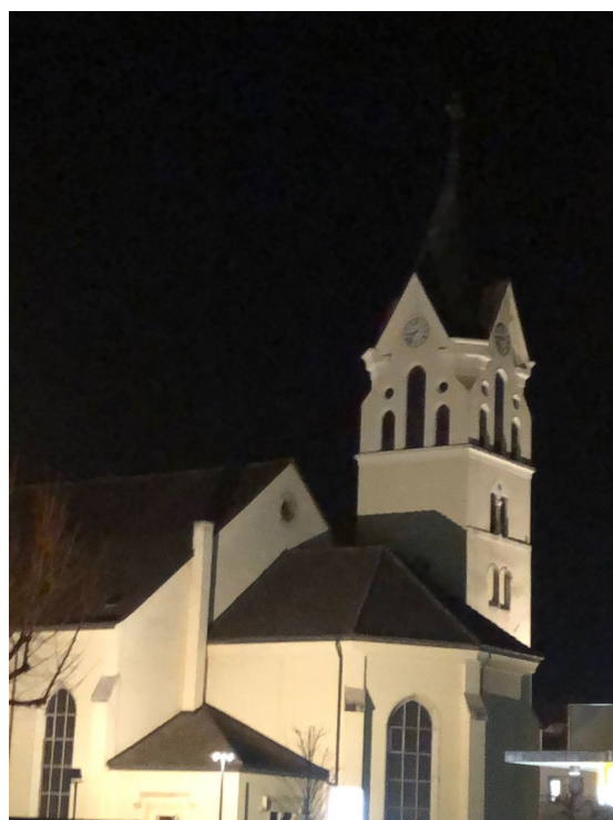
Eglise Saint-Nicolas à Courroux