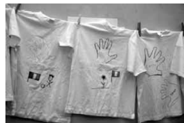
Tous les T-shirts réalisés seront acheminés au Kenya.

emporteront nos T-shirts, ainsi que tout le matériel récolté au cours de l'action lancée à l'occasion de ce temps communautaire. Nous espérons qu'ils seront en mesure de nous faire un petit retour sur leur expérience lors de la kermesse paroissiale du 27 août prochain.