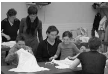
Les familles s'appliquent autour des tables.

La question était de savoir quel sens donner à cette matinée. Après avoir pris connaissance du projet de l'Action de Carême, nous avons plutôt opté pour le soutien à un projet concret et plus « proche » de nous, soit la construction d'un puits permettant d'installer l'eau courante dans un orphelinat au Kenya. Cet orphelinat est soutenu par