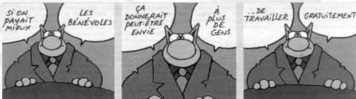
Le chat, Philippe Geluck