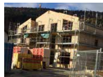
Courtelary: construction des logements adaptés (gauche: août - milieu: septembre - droite: 24 octobre)