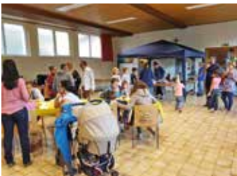
Forum paroissial à Corgémont