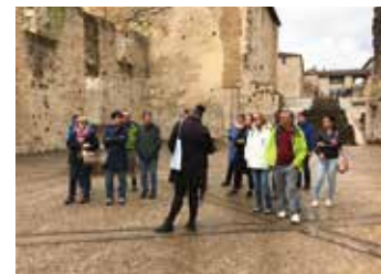
Week-end à Taizé