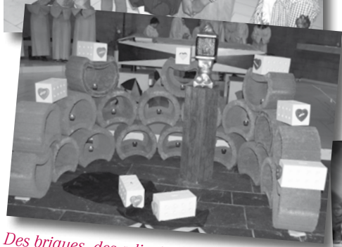
Des briques, des « dizainiers » et le reliquaire ont décoré le chœur de Notre-Dame.