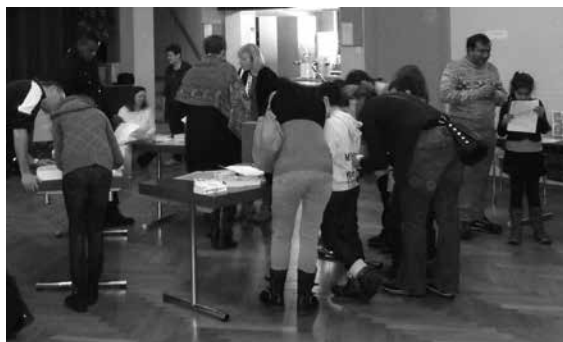
Les visiteurs ont pris le temps de consulter les différents textes pour rechercher les phrases du questionnaire et l'évangile du jour.