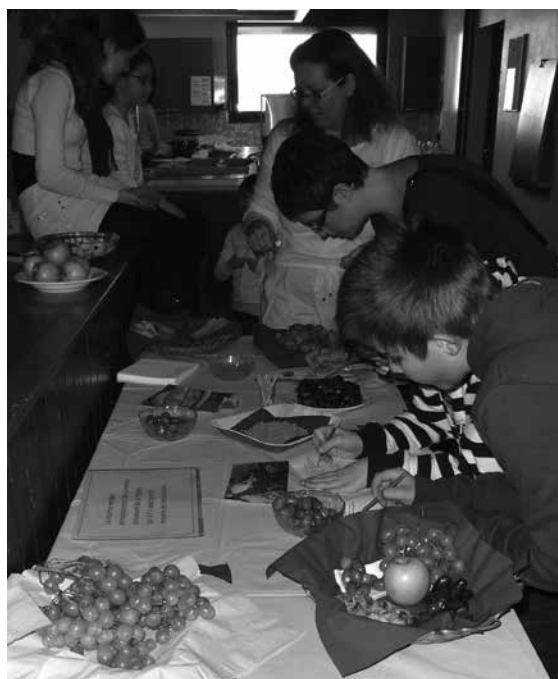
Les plus jeunes ont préféré le marché où on pouvait goûter dattes ou pain azyme.

A noter que le groupe de musiciens récemment constitué cherche des renforts parmi les enfants de la paroisse: en cas d'intérêt, merci de vous adresser à Sandy Müller ou à l'abbé Mitendo.