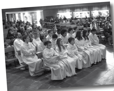
Une partie de l'assemblée avec les servants et les membres de l'Equipe pastorale durant la prédication.