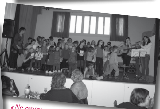
« Ne rentrez pas chez vous comme avant... »