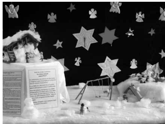
Crèche de Corgémont