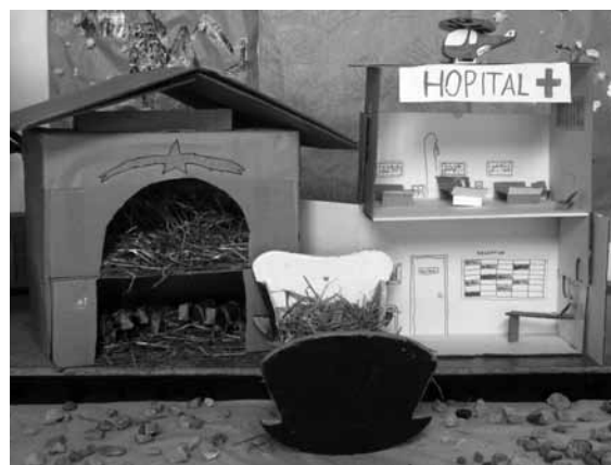
Crèche de Courtelary