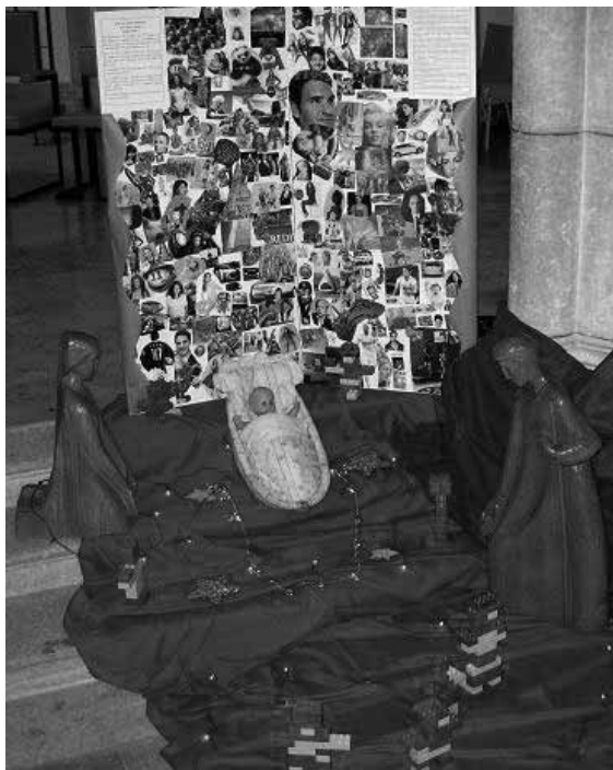
Crèche de Saint-Imier