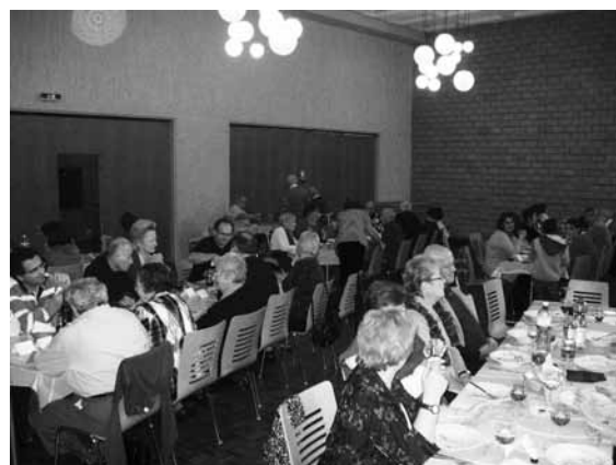
Repas de Noël organisé par la Communauté italienne