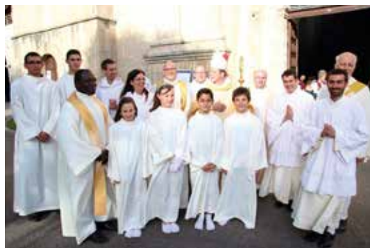
Participation des servants de messe de la Tramata aux festivités du Tricentenaire de Bellelay