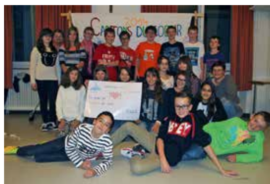
Confirmation 2014 de la Tramata; action de solidarité en faveur des Cartons du Cœur