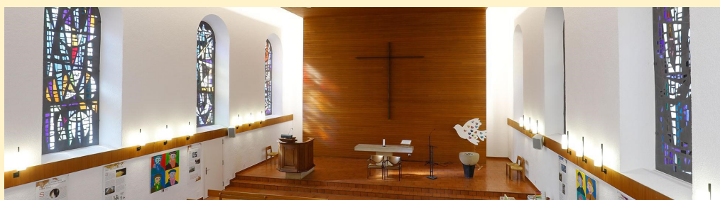
Temple de Delémont

Quand ? Dimanche de Pentecôte le 31 mai 2020, dès le matin, indépendamment de l'heure. La célébration œcuménique pourra être vue durant plusieurs jours.