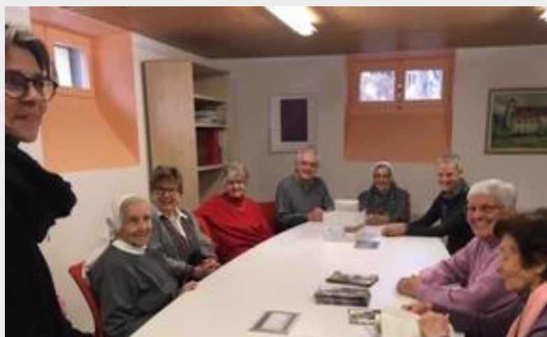
Photo prise le 19 février lors de la mise sous plis des enveloppes de Carême après la messe.

Soucieux d'entretenir l'Église Notre-Dame, le Conseil de paroisse vous informe que des travaux de réfection du clocher de l'Église auront lieu après la semaine Sainte. Des échafaudages seront posés le 20 avril 2020 et y resteront environ deux mois.