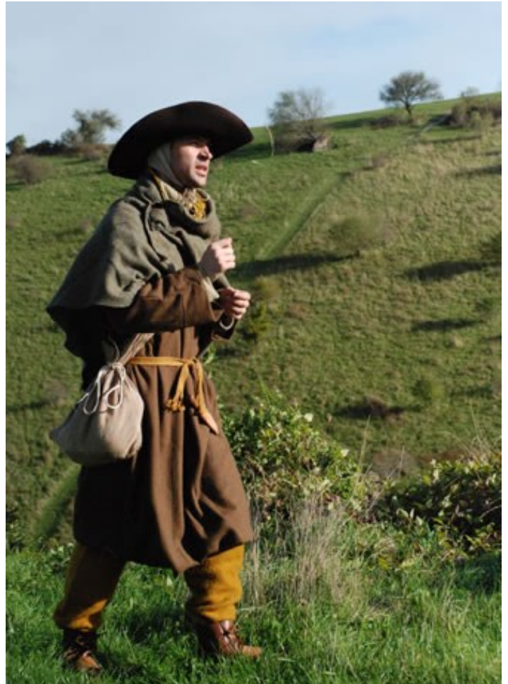
Un homme et sa besace représentant les vêtements du pèlerin du Moyen-âge.