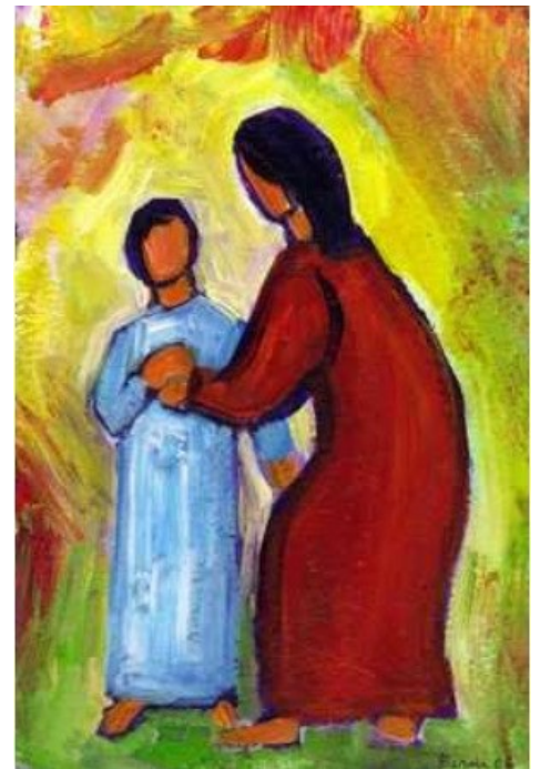
Illustration : Berna Lopez

Alors oui, Marie est modèle pour tous les croyant-e-s. Elle est aussi reflet de cet Amour maternel avec lequel Dieu nous aime, chacun et chacune ! Un Amour, nous dit Saint Jean dans l'évangile de ce dimanche, qui va « jusqu'à donner sa vie pour ceux qu'il aime » (Jn 15, 13). Et dans la 2 e lecture, le même évangéliste souligne que Dieu a toujours l'initiative de l'Amour (1 Jn 4, 10).