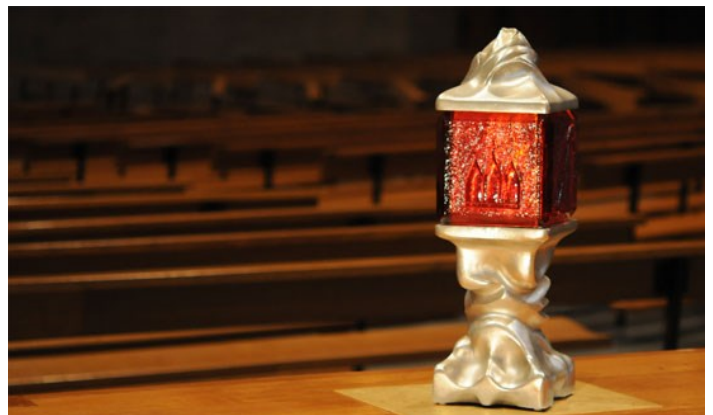
Ci-contre : reliquaire

A cette occasion une fête paroissiale est organisée, avec un repas à l'issue de la célébration dominicale. Des reliques des Saints-Patrons sont conservées dans un reliquaire se trouvant à l'église Notre-Dame.